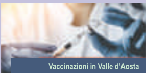
Vaccinazioni in Valle d'Aosta