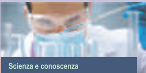
Scienza e conoscenza